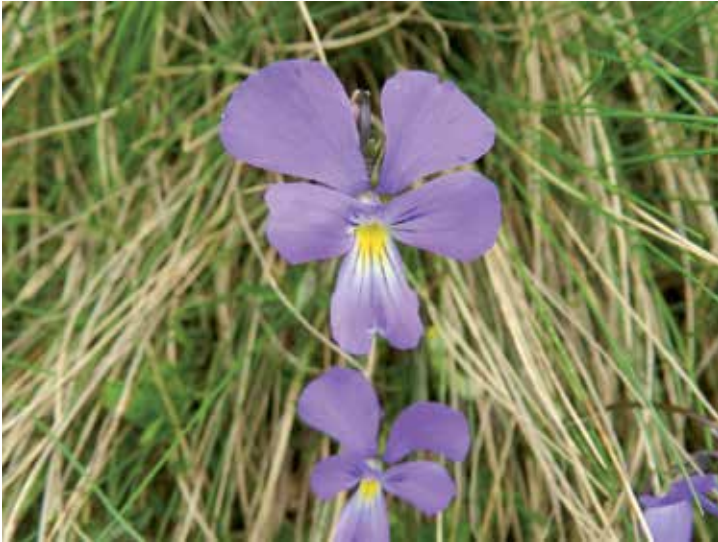
Viola culminis - Croce Domini

I botanici accompagnatori sperano che qualcuno dei partecipanti, avendo intravisto la possibilità di immergersi in una natura forte, selvaggia e colorata, trovi in futuro la strada per ritornare.