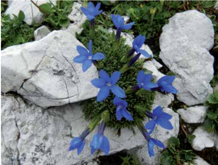
Gentiana terglouensis – Altopiano della Rosetta